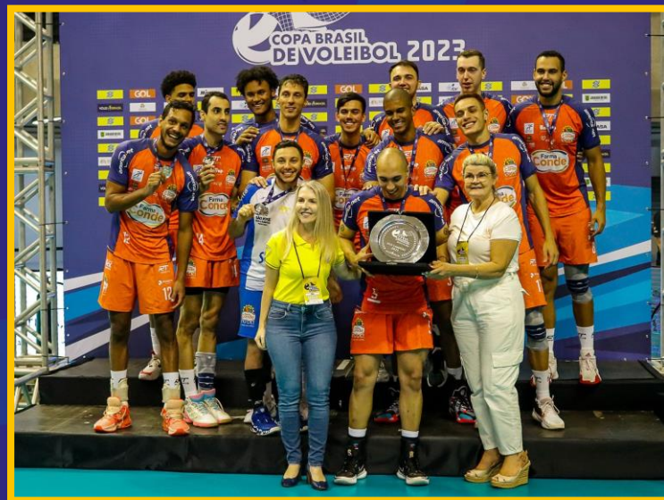
Copa Brasil 2022/23