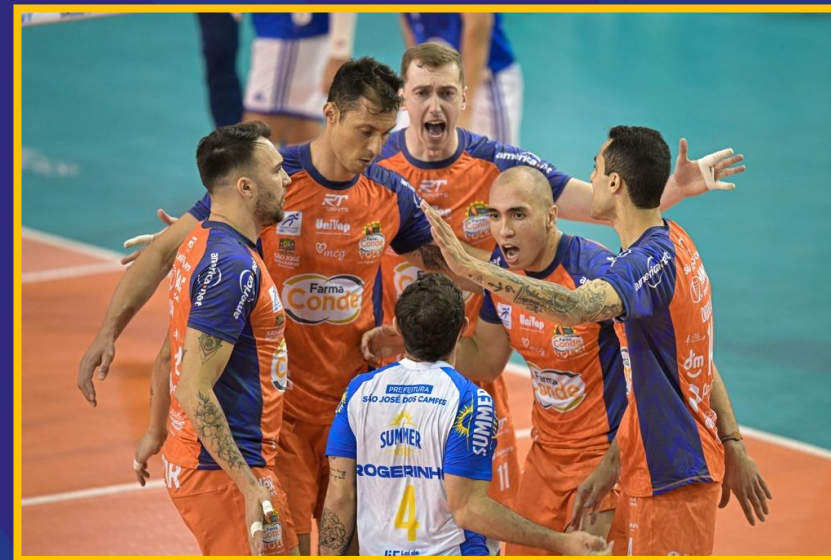
Campeonato Paulista 2022/23