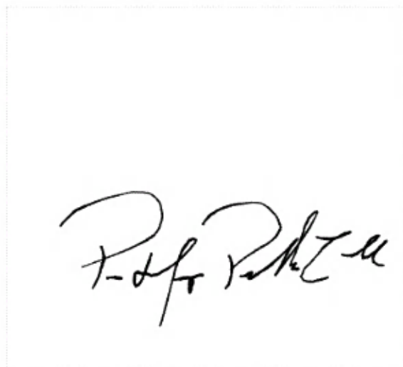
Assinatura de Pedro Henrique Pontarolo Z...

Pontos de autenticação: Assinatura na tela IP: 177.173.201.75 / Geolocalização: -25.434634, -49.278784 Dispositivo: Mozilla/5.0 (Linux; Android 10; K) AppleWebKit/537.36 (KHTML, like Gecko) Chrome/126.0.0.0 Mobile Safari/537.36 Data e hora: Julho 01, 2024, 09:00:39 E-mail: pedro@svdireitodesportivo.com.br Telefone: + 5541992909899 ZapSign Token: b9710316-****-****-****-646d11b26f9d